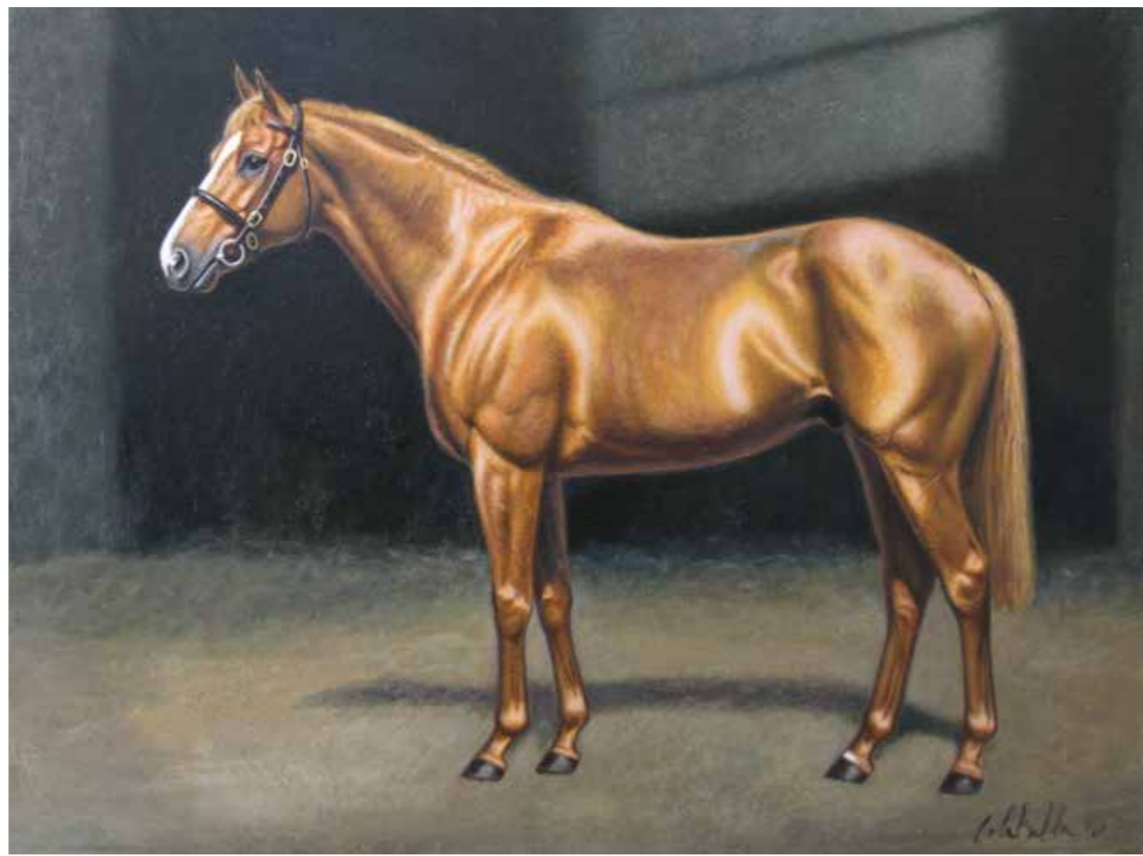
Pur sang anglais Huile sur toile - 46 x 61 cm