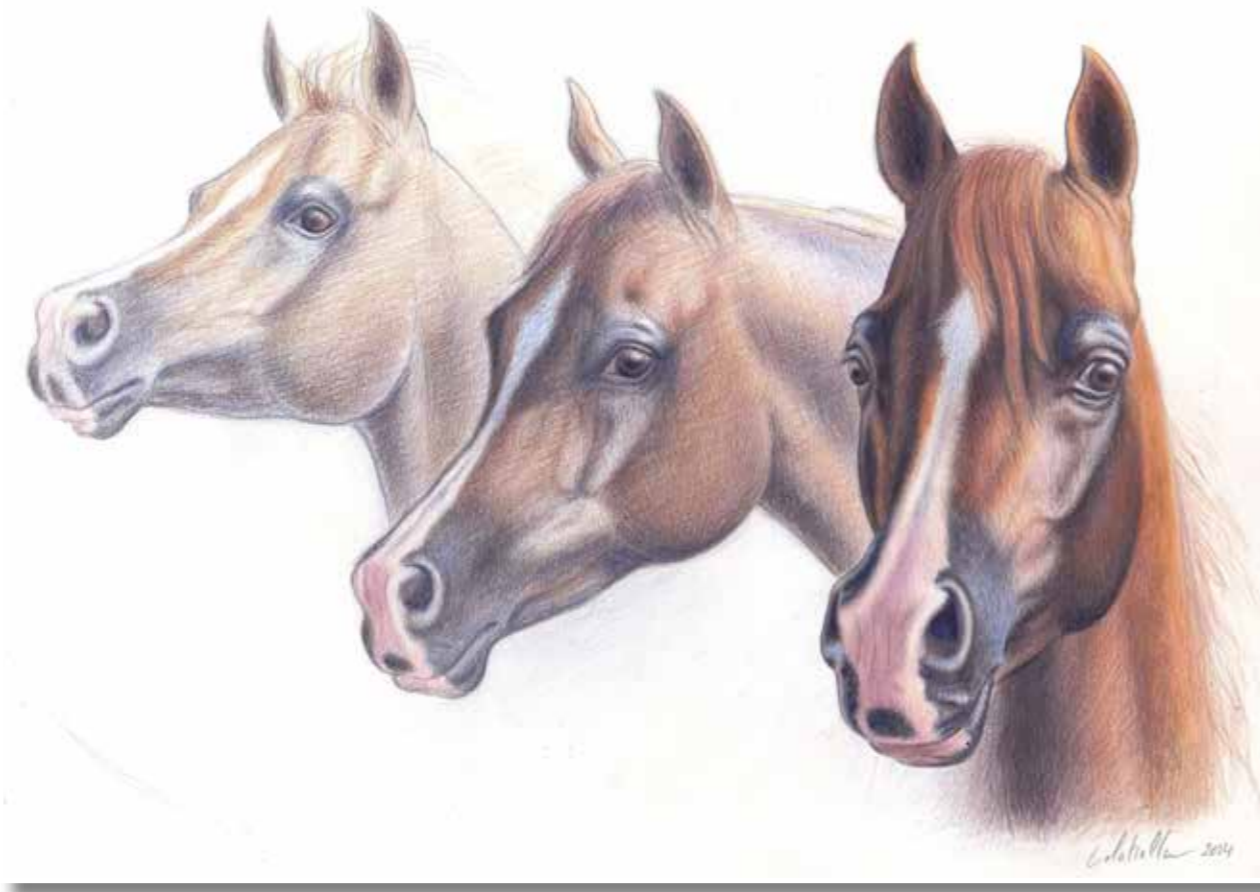
Marquis Cahr, attitudes Étude préparatoire Crayons graphites, 21 x 27 cm