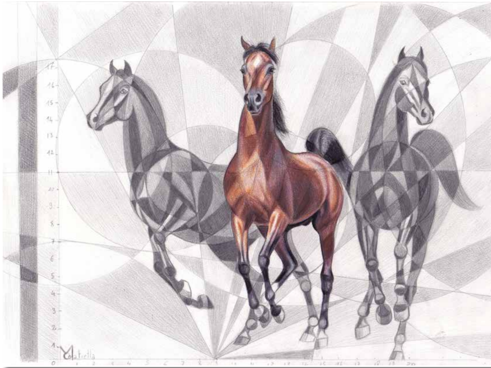
Pur 100 O galop, mètre étalon étude Crayons graphites, pastels et encre - 21 x 27 cm