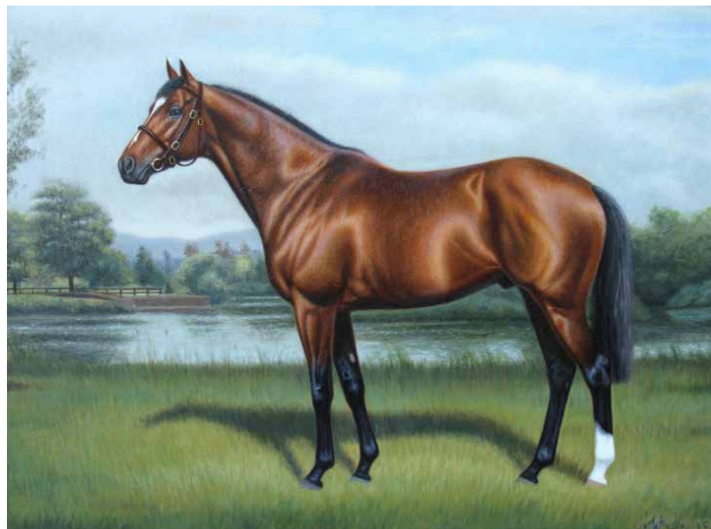
Galiléo Huile sur toile - 46 x 61 cm